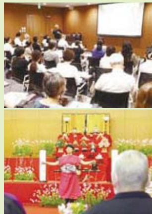
上：2018年度 連続 講座の様子 下：2018年度 ワークショップでの ダンスと会場装飾

医療系・人文社会系・芸術工学系を擁する名古屋市立大学の人材 と、20年以上にわたる芸術工学部でのホスピタルアートの実績を活 かし、幅広く名古屋市関連機関・NPO等と連携し、アートによる医 療福祉環境の向上を目指します。詳細は事業HPをご参照ください。 2018年度事業報告や2019年度事業予定なども掲載しています。