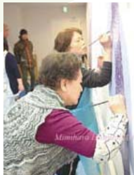
耳原総合病院の壁画アート制作風景 (第2回講座) / 兵庫県立こども病院 受付ロビー (第5回講座)