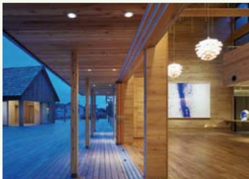
倉敷中央病院の温室 / 千里リハビリテーション病院の新棟エントランス (キックオフ講座)